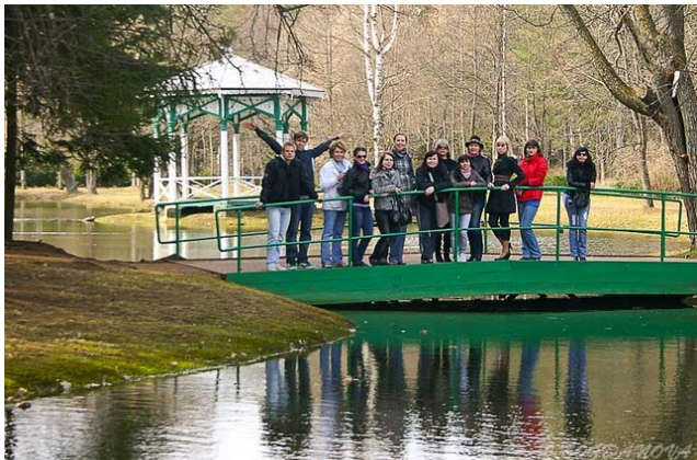
Пешеходная экскурсия по Нарва-Йыэсуу

24.05.2010 17:36 - Обновлено 30.08.2010 12:21